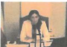
Pekarová uklidňuje vládní skandal: Občanů se to nedotýká