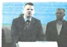
Bum, na Fialu se Stanjurou mří trestní oznámení