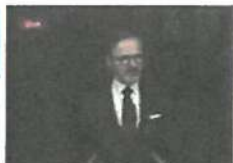
Premiér Fiala: Neříkejte nám, co máme říkat lidem